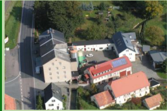
Mühle Miltitz www.muehle-miltitz.de

Besichtigung Mühle und Wasserkraftanlage, Bewirtung & Musik, Mineralien, Steinschmuck, Goldwäsche & Edelsteinwürfeln, Steinmetze bei der Arbeit und Steinbearbeitung für Kinder