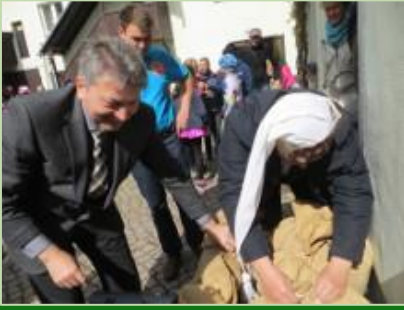
Eröffnung 2016 in der Mittelmühle, Garsebach